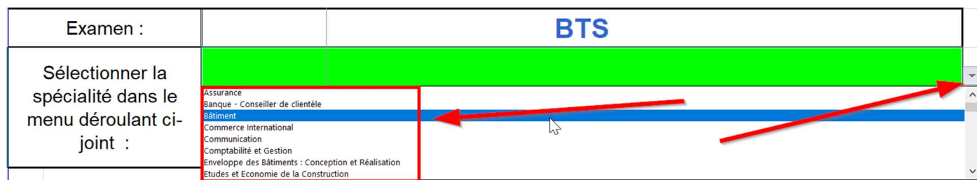
Figure 5: le livret est déjà paramétré pour de nombreux BTS

Le fichier est paramétré pour s'adapter à plusieurs BTS, il suffit de choisir le BTS concerné et le fichier se met à jour avec les intitulés des épreuves BTS choisis.